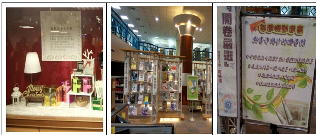
上圖：建國科大圖書館--多媒體展示 下圖：建國科大圖書館--主題書區