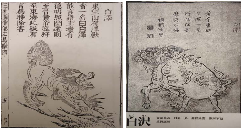
圖 4-2《三才圖會》卷之白澤神獸圖 圖 4-3《畫圖百鬼夜行全畫集》之白澤神獸圖

圖 4-3 61 所示乃日人鳥山石燕所繪《畫圖百鬼夜行全畫集》中的白澤神獸也有獅形的特徵，是隻身披捲曲長毛，目光炯炯的靈獸，其躍然前行，委身低頭的姿態，加上凝然的眼神全神貫注，似乎企圖掌握環境中的線索與行動的方向。《雲笈七籤》載錄：