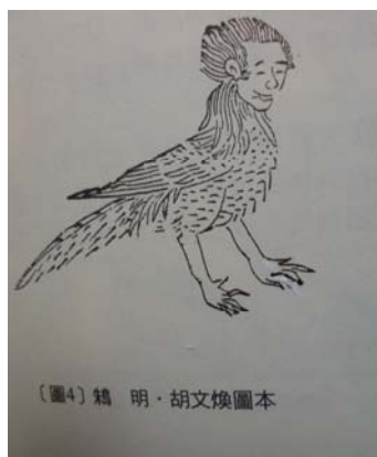
圖 2-1 丹朱魂魄化成的鴉鳥