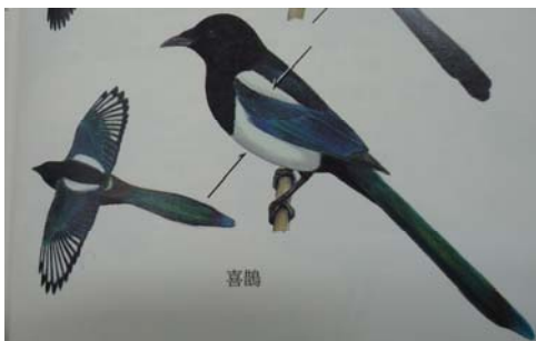
圖 2-3 喜鵲

《周易》中載錄鵲鳥有「先物而動，先事而應」的神祕力量；而鵲鳥為陽鳥，鵲鳥鳴叫了，當天必是晴天，鵲鳴就成為「行人將至」的預兆，可省親訪友，遠行的遊子或戍邊服役的兵丁可望歸來。