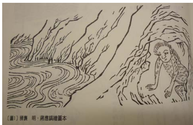
圖 2-2 預兆大繇的猾褢

郭璞《圖讚》：「猾褢之獸，見則興役。」黃省曾《讀山海經詩》：「國邑有大繇，康莊行猾褢。」 12 穴居的的猾褢(見圖 2-2) 13 樣子像人，全身長滿豬樣硬毛，冬天蟄伏不出，叫聲如斫木之音，只要牠出現，該地將會有「大繇」。「大繇」或為「社會動亂」，或可看作是族內發生了爭執，這些都是有族規、有組織的部族社中不幸的事件。 14