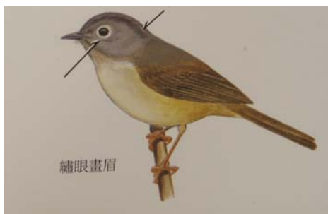
圖 2-4 泰雅族靈鳥西列克鳥—繡眼畫眉

台灣原住民各族也有依鳥兆預測吉凶而決定行動習俗，各族群依不同生態空間與活動範圍，觀察出不同鳥類的型態與特徵，而有大同小異的預兆鳥神話傳說。 31 泰雅族鳥占神話中，西列克鳥被泰雅族人視為靈鳥：