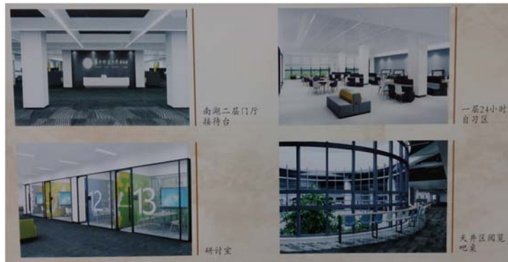
新分館空間示意圖