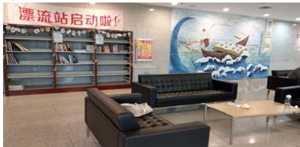
學生志願者協會規劃之圖書漂流站

志願者除排班上書、整架、清理占座情形的日常庶務工作外，另協助圖書館承辦各類型特色活動，例如 423 世界閱讀日(武漢科技大學圖書館，2017)、新生入館教育、愛心送書活動、圖書漂流站、電子資源推廣活動等。(武漢科技大學圖書館青年志願者服務隊，2016)