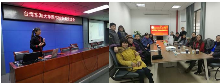
向華中師範大學及武漢科技大學圖書館進行簡報與交流(左圖：華中師範大學圖書館鐘思攝)