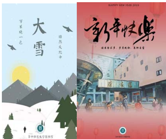
學生繪製二十四節氣與西曆元旦祝賀圖

巧妙運用學生特長，陸續於每一節氣推出祝賀小圖，甚至搭配西曆跨年推出元旦新年賀圖，發佈於微信公眾號，增添樸實對話框中傳遞給讀者的溫暖。二十四節氣祝賀圖推行一年，甚至可進一步印製成明信片，作為華中師範大學圖書館專屬文創產物。