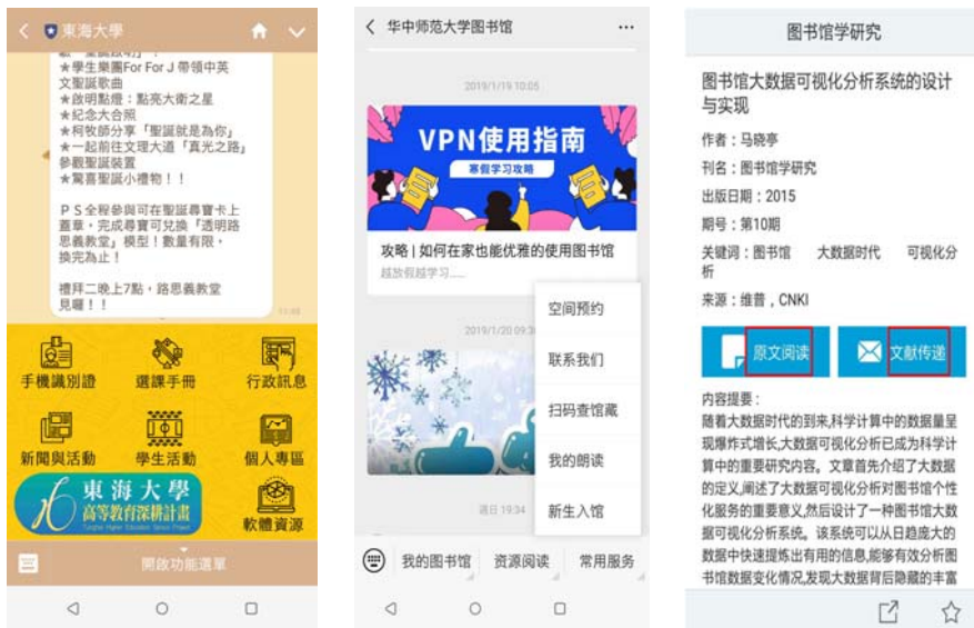
東海大學 Line 官方帳號對話框 Menu，圖書館尚未開立官方帳號(左圖)

此外，若圖書館官網採用響應式網頁設計，透過行動載具使用微信或 Line 串聯圖書館推廣頁面時，閱讀體驗將較為舒適。