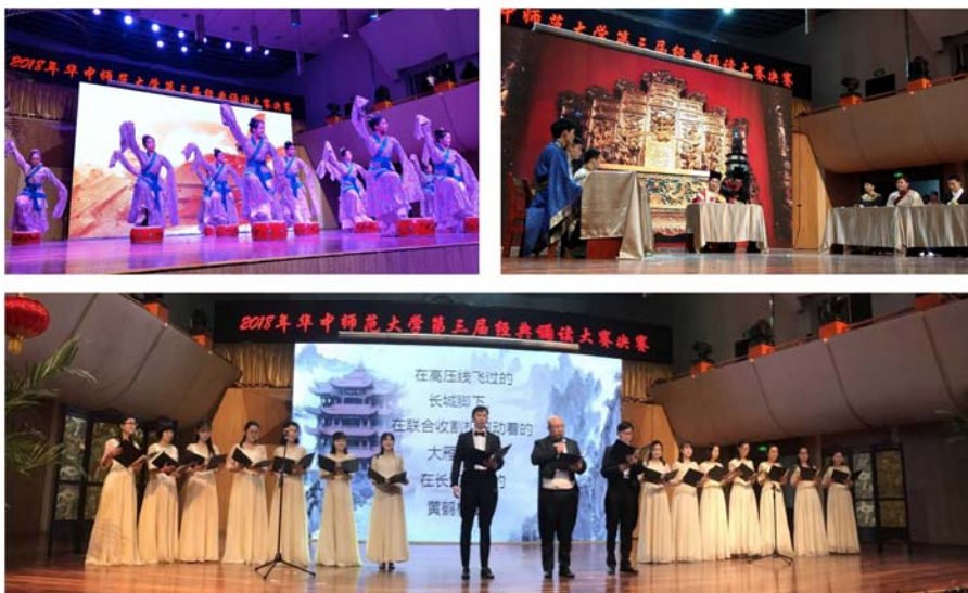
「經典·盛宴」融合讀、誦、演，展現中國傳統文化

經典誦讀大賽不僅止於活動，從初期劇本篩選、演出的點評嘉賓，皆邀請富有文學涵養的教授進行審核與點評，提升整場誦讀活動的專業性與多元性。