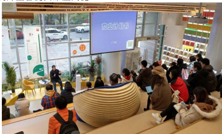
倍閱書店階梯空間多元化使用

沙龍、文創、手作、鮮花的複合式區域，圖書館與書店結合的嶄新空間頗受師生喜愛與席座閱覽。