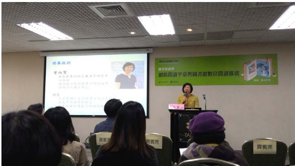
圖 3 圖書館論壇活動現場